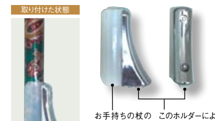
このホルダーにより、さまざまな場所に掛けられるようになります。

お手持ちの杖のシャフト部分に簡単に取り付けられるミニサイズのホルダー。外出先で杖を掛けられるようになり安心です。